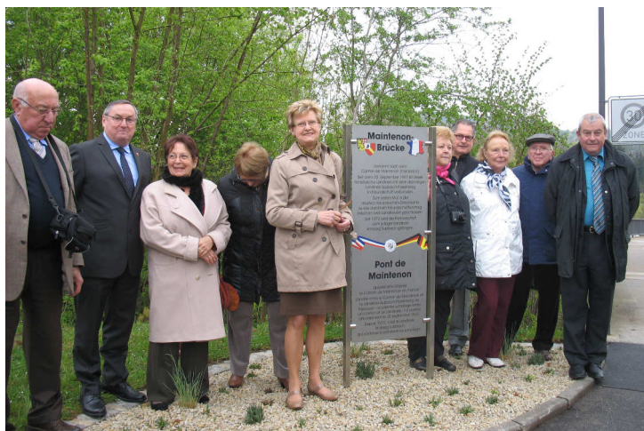
La délégation française à cette inauguration

Pont de Maintenon appelé ainsi d'après le canton de Maintenon en France. L'amitié entre le canton de Maintenon et le Landkreis de Sulzbach-Rosenberg de l'époque - le premier jumelage entre un canton et un Landkreis - fut scellée officiellement le 30 septembre 1967. Depuis 1972, c'est le Landkreis d'Amberg-Sulzbach qui continue d'entretenir ce jumelage.