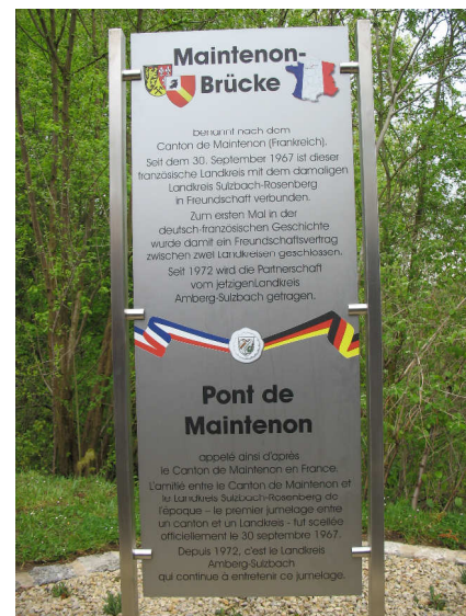
La plaque commémorative