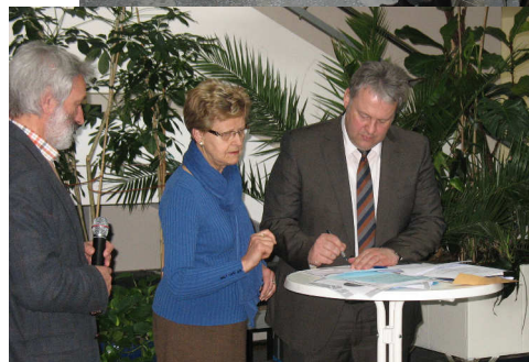
Ci-dessus : le groupe de réflexion franco-allemand