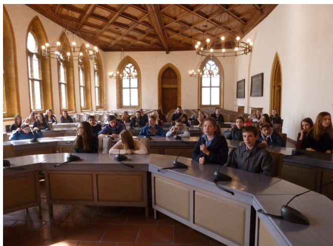
Les collégiens d'Epernon sont accueillis à Amberg

Le Comité de jumelage a participé au financement de cet échange et remercie l'encadrement du collège d'Epernon pour son organisation. Un nouvel échange est déjà en préparation pour 2016.