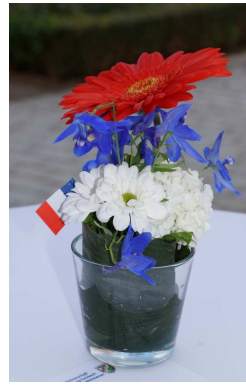
Une décoration jusque dans le détail

La salle était décorée aux couleurs franco-allemandes, et animée par une formation de jeunes musiciens et un groupe en costume traditionnel.