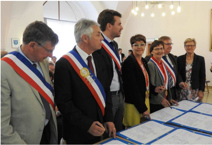
Après que chacun des participants eut ensuite signé le document, un joyeux repas fut servi dans une salle proche.