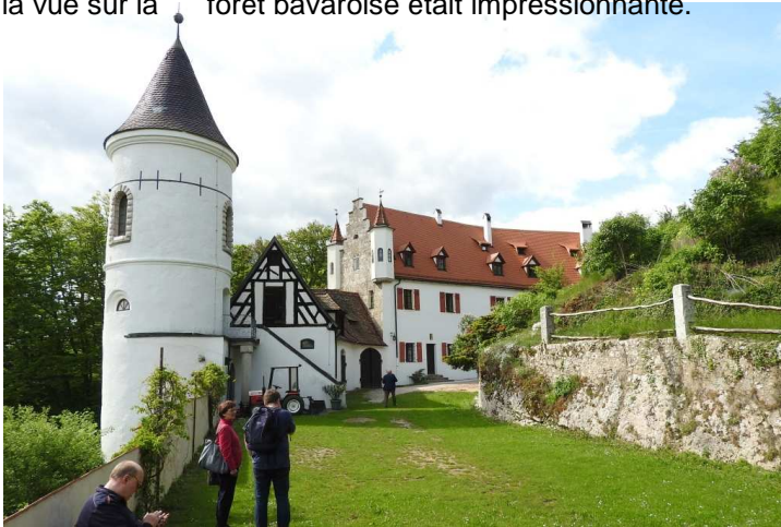
Le groupe en visite au château de Neidstein

Le château de Neidstein, situé sur un promontoire rocheux, fut un temps la propriété du Baron Von Brand, initiateur de notre jumelage côté allemand. De la terrasse de ses jardins, la vue sur la forêt bavaroise était impressionnante.