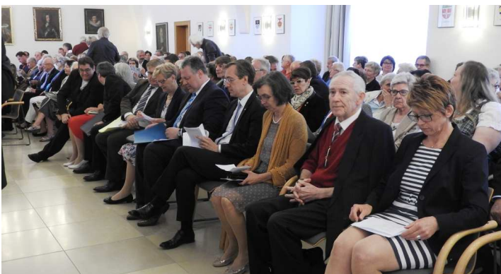
Dans la grande salle du Landratsamt, chacun relit ses notes et révise son discours ...