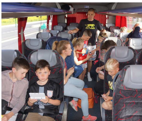
Les jeunes sapeurs pompiers en route pour Sulzbach

Deux bus avaient été affrétés et nous étions 63 au départ ce mercredi matin 24 mai ; direction : la Bavière ! Une vingtaine d'autres adhérents, dont huit membres des « Amis d'Illschwang » de Saint-Piat, avaient choisi de se rendre chez nos amis en voiture ou en avion pour raisons personnelles. Fait particulier : un groupe de huit jeunes sapeurs pompiers de Gallardon et leurs