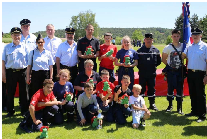
Les jeunes pompiers de Gallardon, leurs formateurs et leurs homologues allemands

Après avoir visité la caserne d'Amberg le vendredi après midi, ils participaient le samedi matin, comme invités d'honneur, à un tournoi organisé entre 10 casernes de jeunes sapeurs pompiers locaux, avec exercices chronométrés de mise en place de matériel et attaque d'un feu. Face à leurs jeunes homologues allemands, et devant les hauts responsables de la formation en Bavière, ils ont brillamment défendu les couleurs françaises !