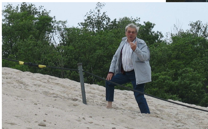
L'ascension du Mont Kaolino, version sportive