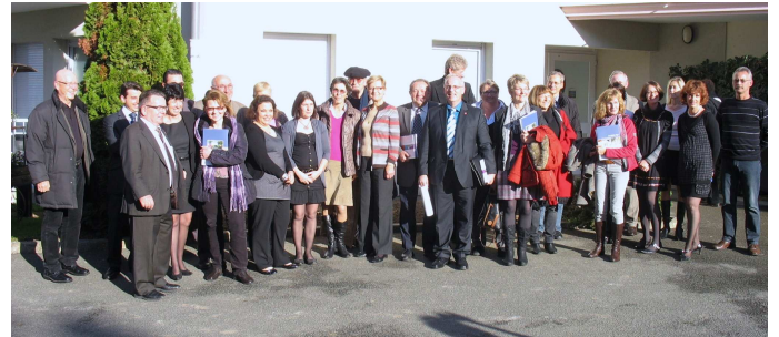
La délégation allemande en visite à la Maison de retraite St-Charles de Chartres