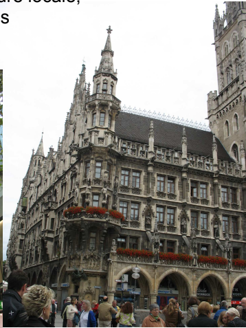
L'hôtel de ville de Munich