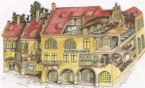
Le groupe se restaure à la Hofbräuhaus

Le repas de midi nous était offert dans la célèbre et ancienne brasserie Hofbräuhaus , temple de la bière depuis plusieurs siècles.