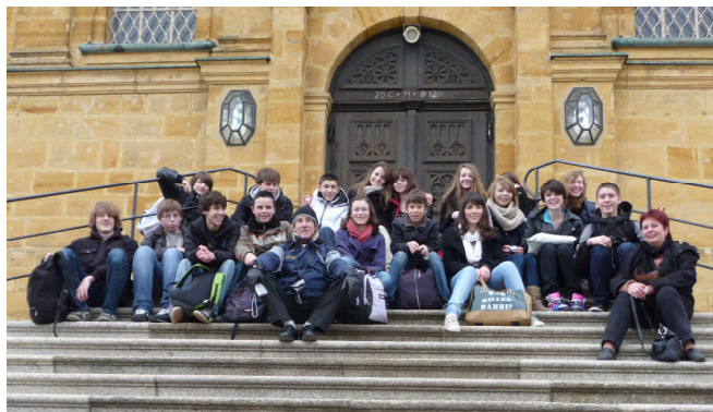
Le groupe de collégiens français et leurs accompagnateurs à Amberg

Les jeunes français ont visité Amberg et la petite église de Mariahilfberg et ont été reçus à la Mairie. Il ont également visité la ville de Nuremberg, le site des congrès du parti national-socialiste et le musée Dürer, ainsi que la ville de Ratisbonne.