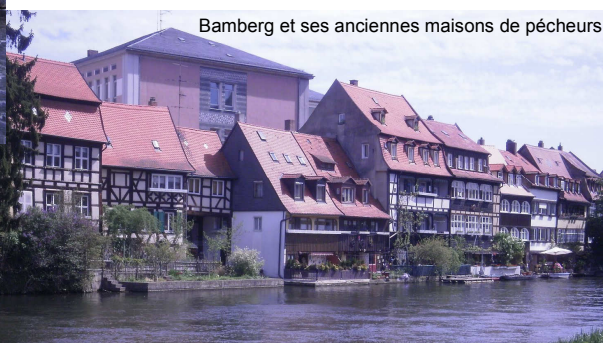
Bamberg et ses anciennes maisons de pêcheurs

chacun a pu savourer les promenades dans la campagne locale et la chaleur de l'accueil bavarois. Le soir, un repas festif clôturait cette belle journée. Une visite détaillée de la ville d'Amberg était au programme du lundi avec déjeuner dans un ancien restaurant de la ville, ainsi qu'un circuit « énergies renouvelables » avec le parc solaire de Hohenburg et le champ d'éoliennes d'Edelsfeld avant un retour le lendemain vers les horizons euréliens.