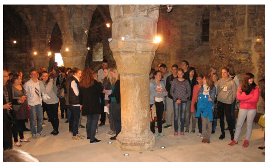
Collégiens allemands et français aux Pressoirs d' Epéron