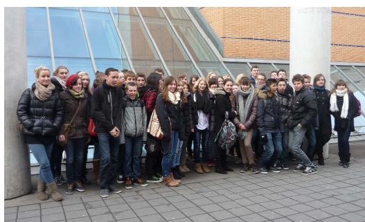
Les collégiens français et leurs accompagnateurs à Amberg