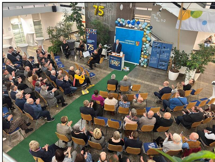
L'assistance aux 75 ans de la V.H.S.