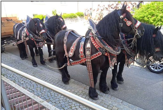
Les chevaux du Kirwa

* KIRWA : dialecte bavarois pour Kirchweih, fête patronale