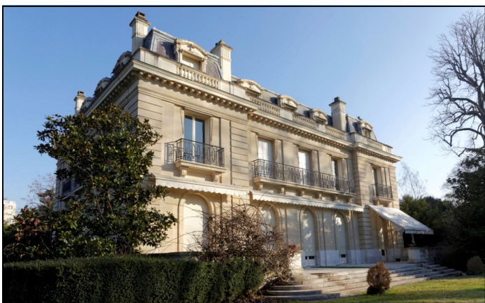
La Villa Windsor dans le Bois de Boulogne