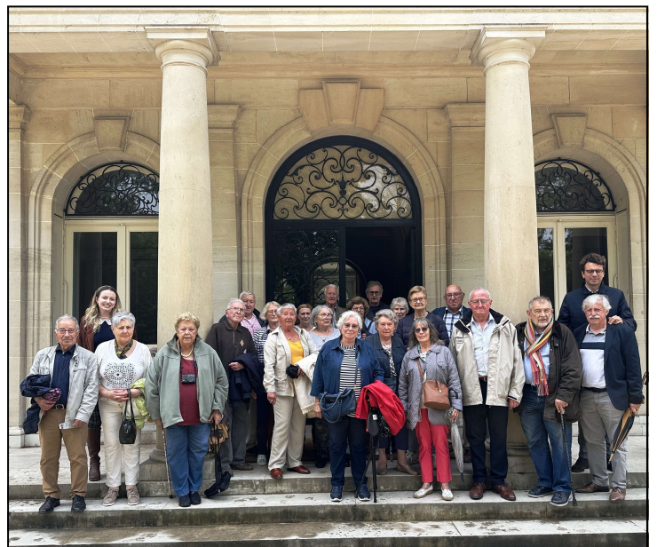
Le groupe du Comité en visite

Actuellement en cours de réhabilitation par la Fondation Mansart, la célèbre Villa Windsor sera ouverte à la visite à l'été 2025. En avant première, 21 adhérents du Comité ont participé à cette visite le 21 juin et découvert les magnifiques salons en enfilade de ce joyau d'architecture.